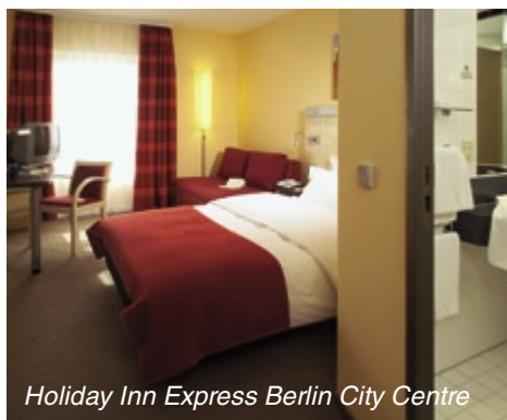
Holiday Inn Express Berlin City Centre

Frühstücksrestaurant, Bar, Konferenz- und Empfangsräume, Terrasse, Lift, Hotelsafe, Parkplatz.