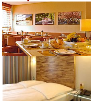
Frühstücksraum und Zimmerbeispiel

Gültig vom 01.01.2009 - 31.03.2009 und vom 01.11.2009 - 21.12.2009