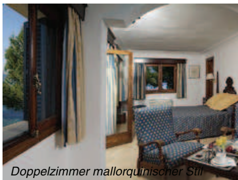
Doppelzimmer mallorquinischer Stil

Réception, Lift, Bar, Süsswasserschwimmbad mit Kinderabteil, Snack-Bar. Massagen beim Pool (nur im Sommer), Gratis-Liegestühle, -Sonnenschirme und -Badetücher. Elegantes Restaurant mit Meerblick und Terrasse für Frühstück (Buffet), Mittag- und Abendessen ist à la carte (lange Hosen für Herren erwünscht). Verschiedene Golfplätze in der Nähe. Greenfee-Ermässigung auf fast allen Golfplätzen der Insel.