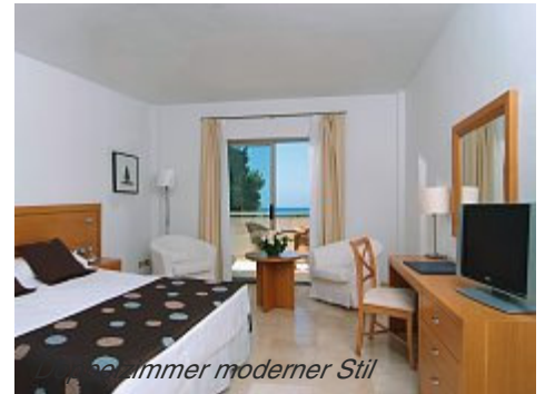
Zimmer moderner Stil