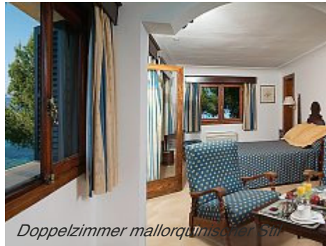
Doppelzimmer mallorquinischer Stil