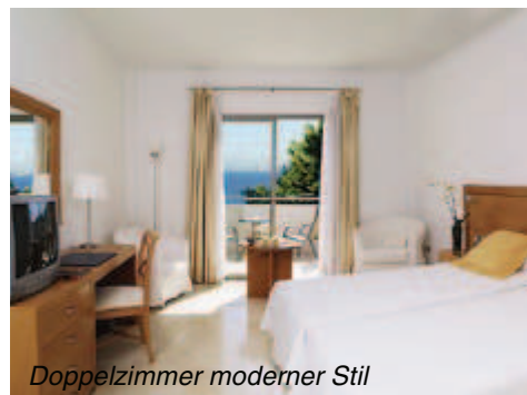
Doppelzimmer moderner Stil