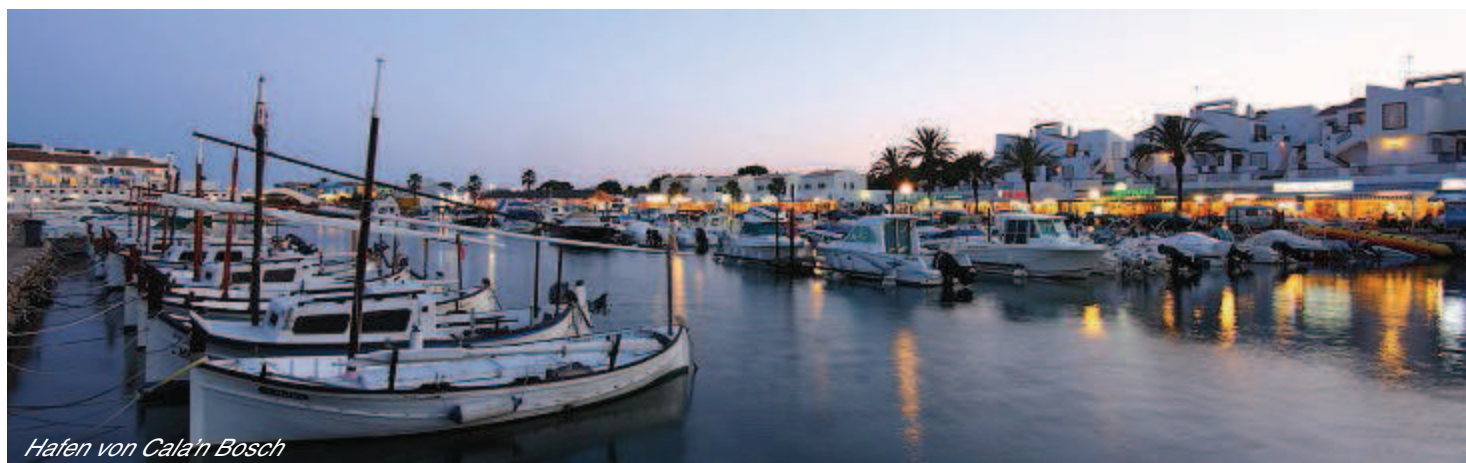
Hafen von Cala'n Bosch

Für weitere Informationen oder Reservation: