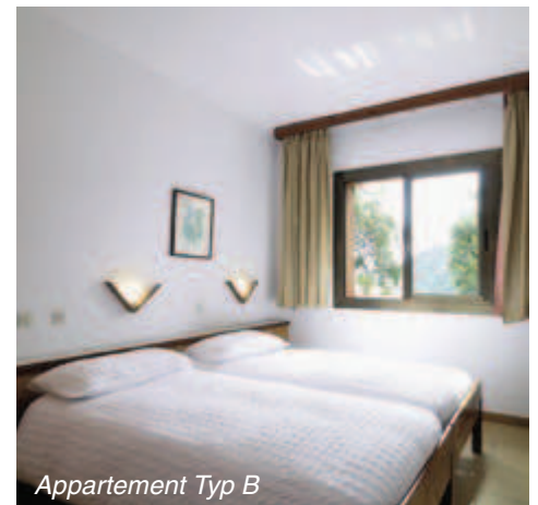
Appartement Typ B