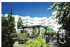
Jasmin Court Garden