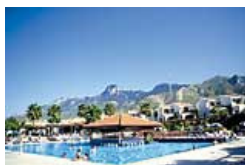
Hotel Olive Tree