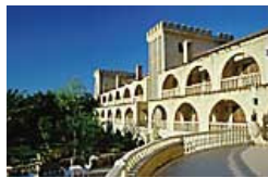
Hotel Chateau Lamboussa