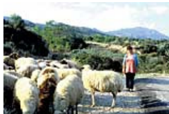
Wandern in Nordzypern