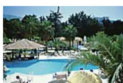
Hotel Pia Bella