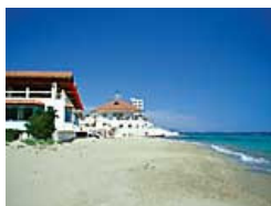
Salamis Bay Conti