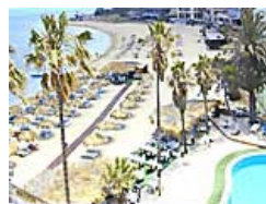
Hotel Palm Beach