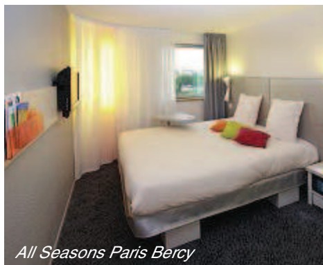
All Seasons Paris Bercy