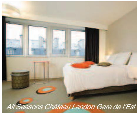
All Seasons Château Landon Gare de l'Est

1.1.–31.3.11/9.7.–29.8.11/22.10.–29.12.11 3 Nächte buchen = 2 Nächte bezahlen