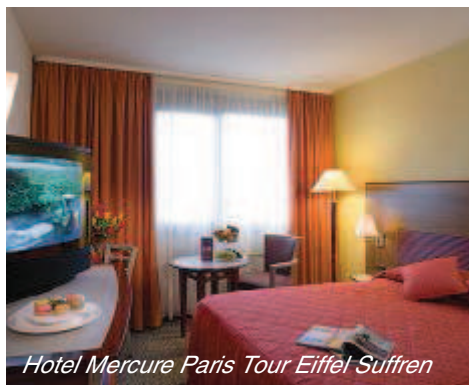
Hotel Mercure Paris Tour Eiffel Suffren

1.1.–7.8.11/21.10.–31.12.11 Anreise FR, SA oder SO (ausser bei Messen/Anlässen) 3 Nächte buchen = 2 Nächte bezahlen