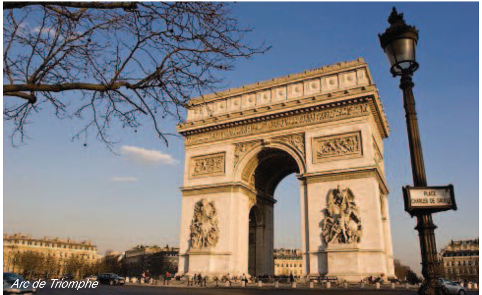
Arc de Triomphe

Parkservice am Flughafen Bern-Belp eingeschlossen. (weitere Informationen Seite 2)