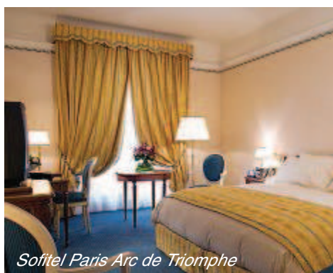
Sofitel Paris Arc de Triomphe