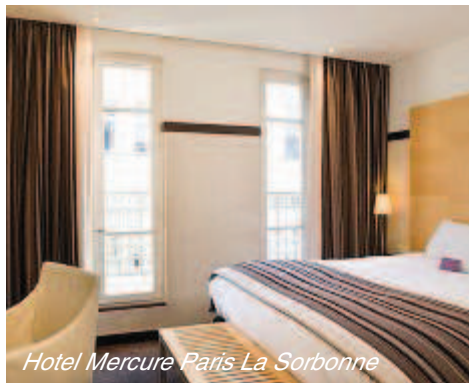
Hotel Mercure Paris La Sorbonne