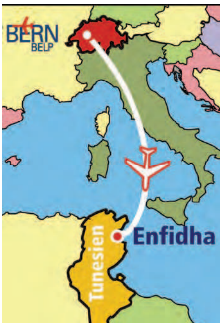
Erstklasshotel AZIZA Thalassa & Golf****