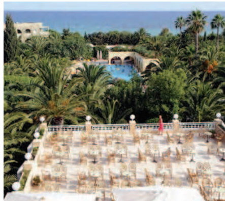
Clubhotel MEDITERRANEE ***plus